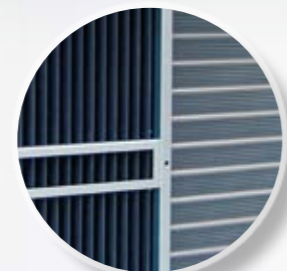
Эффективные теплообменники, обеспечивающие высокое КПД при нагреве и охлаждении воздуха