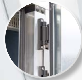
Инспекционные двери на петлях. Специальная система двойного уплотнения