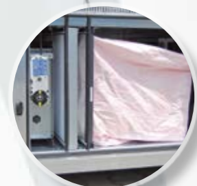
Двойная очистка воздуха. Фильтры класса M5 и F7. Воздушные заслонки с электроприводами внутри установки