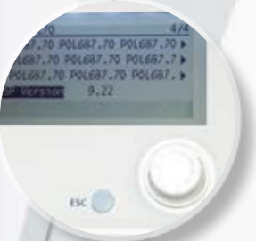
Быстрое и легкое обслуживание при помощи панели NMI