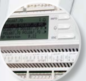
Контроллер типа Climatix с протоколами ModBus, LON, Ethernet, BACnet IP