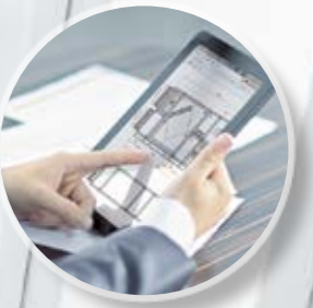
Интуитивная программа подбора ОНЛАЙН