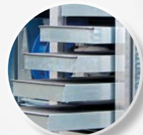
Выдвижные шумопоглощающие пластины, облегчающие чистку установки