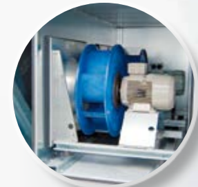
Виброизоляторы для снижения переноса вибрации