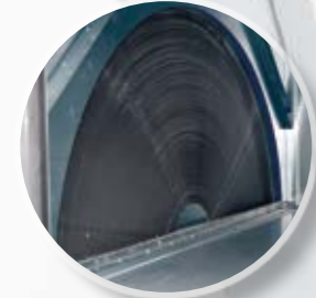
Роторный рекуператор, КПД которого достигает 90%