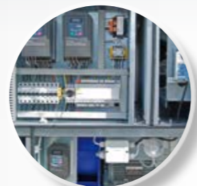
Элементы автоматики, встроенные внутри установки, не подвергаются воздействию атмосферных факторов